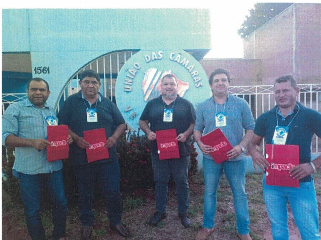
22/06 Inscrições na Cede da UCV-MS