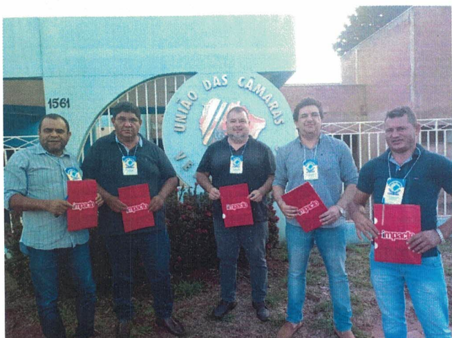
22/06 Inscrições na Cede da UCV-MS