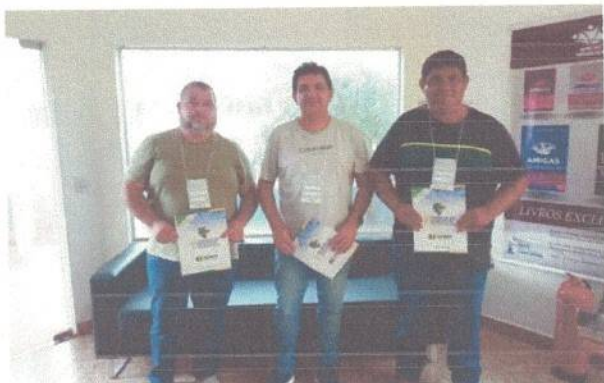
Na União de Câmaras para as inscrições