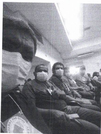
Com meus colegas na palestra