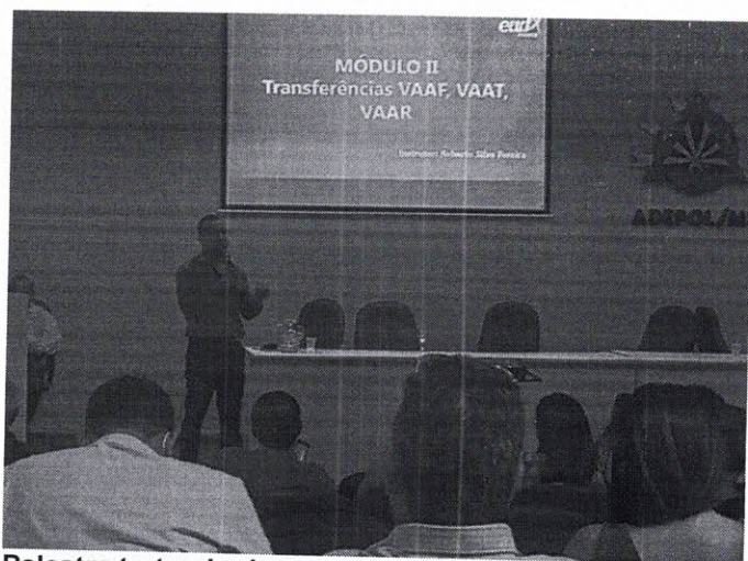
Palestra tratando do novo FUNDEB