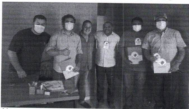
Abertura e Inscrição do Seminário na Sede da União